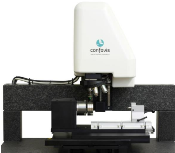
Confovis Oberflächen- und Drallmessplatz